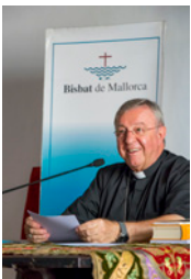
SEBASTIÀ TALTAVULL ANGLADA, Bisbe de Mallorca