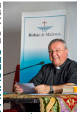
SEBASTIÀ TALTAVULL ANGLADA, Bisbe de Mallorca