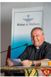
SEBASTIÀ TALTAVULL ANGLADA, Bisbe de Mallorca