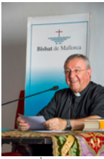
SEBASTIA TALTAVULL ANGLADA, Bisbe de Mallorca