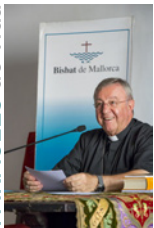
SEBASTIÀ TALTAVULL ANGLADA, Bisbe de Mallorca