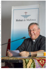
SEBASTIÀ TALTAVULL ANGLADA, Bisbe de Mallorca