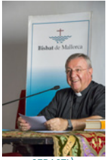
SEBASTIÀ TALTAVULL ANGLADA, Bisbe de Mallorca