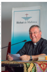
SEBASTIÀ TALTAVULL ANGLADA, Bisbe de Mallorca