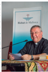
SEBASTIÀ TALTAVULL ANGLADA, Bisbe de Mallorca