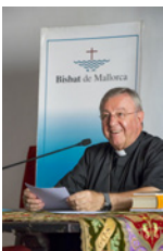
SEBASTIÀ TALTAVULL ANGLADA, Bisbe de Mallorca