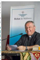
SEBASTIÀ TALTAVULL ANGLADA, Bisbe de Mallorca