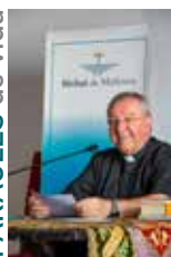
SEBASTIÀ TALTAVULL ANGLADA, Bisbe de Mallorca