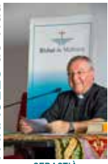
SEBASTIÀ TALTAVULL ANGLADA, Bisbe de Mallorca