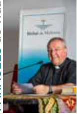
SEBASTIA TALTAVULL ANGLADA, Bisbe de Mallorca