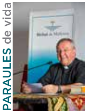
SEBASTIÀ TALTAVULL ANGLADA, Bisbe de Mallorca