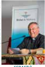
SEBASTIÀ TALTAVULL ANGLADA, Bisbe de Mallorca