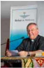
SEBASTIÀ TALTAVULL ANGLADA, Bisbe de Mallorca

Amb la festa de Crist Rei, aquest cap de setmana tancam l'Any Litúrgic i ens preparam per començar, diumenge que ve, el temps d'Advent, camí que farem junts cap a Nadal. Necessitam respirar al ritme de tota l'Església quan tot just hem celebrat un