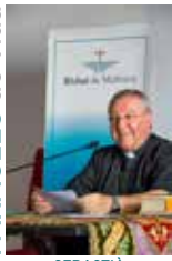
SEBASTIA TALTAVULL ANGLADA, Bisbe de Mallorca